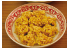
キルギスのかりんとう「チャクチャク」(左)と揚げパン「ボルソック」