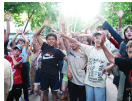
サマーキャンプ「オケアン」の元気な子どもたちと交流