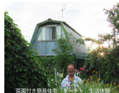
菜園付き簡易住宅「ダーチャ」生活体験